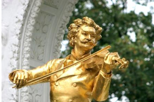
Johan Strauss Memorial