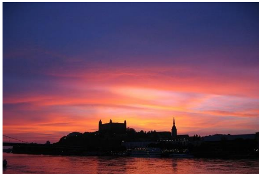
Bratislava by night