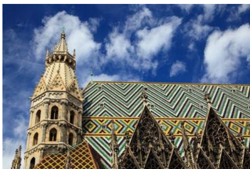
Stefansdomen, Wiens landemerke